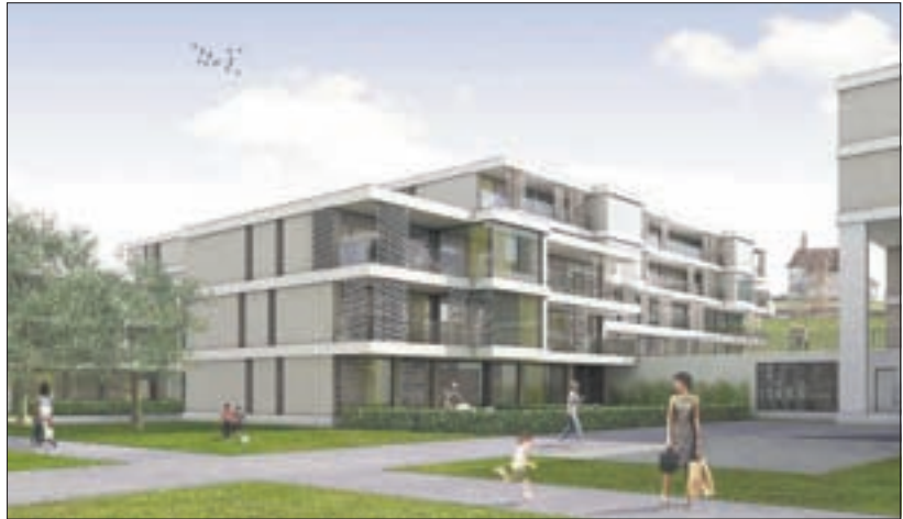
Eines der Projekte für das Hofstetterfeld.

Den Wettbewerb hatten die Landeigentümer veranstaltet, die Familiengemeinschaft Beckenhof und die Erbgemeinschaft Wey Heinrich Erben. Die Realisierungsträger, die bereits im Juryprozess vertreten waren, können nun den Landeigentümern Offerten unterbreiten: Es sind dies die Estermann Bauunternehmung, Sursee; Luzerner Pensionskasse Immobilien, Luzern; Schmid Generalunternehmung,