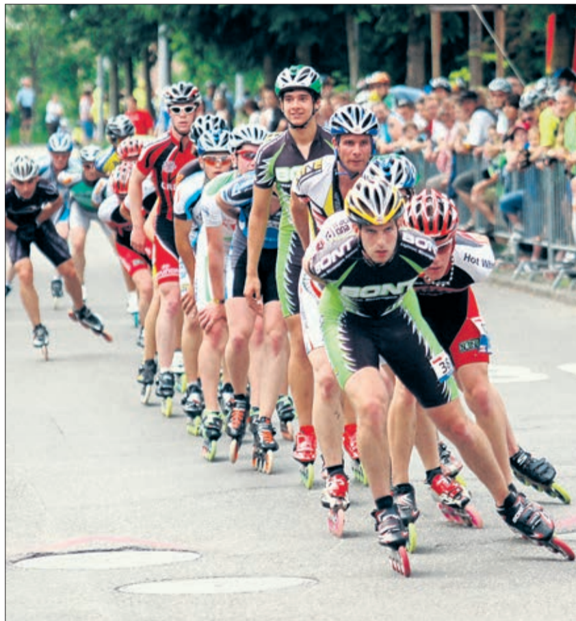
Die «Inline-Züge» rollen frühestens im nächsten Jahr wieder um den Sempachersee.

Hauptgrund für die Absage waren am Ende aber Sicherheitsauflagen, die der Veranstalter nicht rechtzeitig erfüllen konnte. Weil der Organisator gemäss Ruedi Amrein auch bei der Luzerner Polizei noch offene Rechnungen hat, war der Kanton nicht bereit, für das Sicherheitsdispositiv der Veranstaltung zu sorgen. «Und wenn für uns die Sicherheit der Teilnehmer nicht gewährleistet ist, sind wir nicht bereit einen